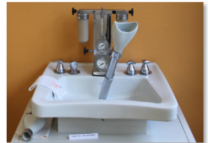
Inhalations- u. Speibecken